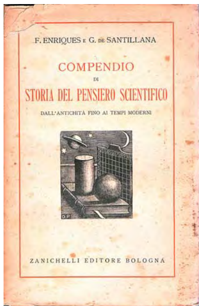
Fig. 34 - Federigo Enriques e Giorgio De Santillana, Compendio di storia del pensiero scientifico , Bologna, Zanichelli, 1937.

Nell'opera Per la storia della logica. I principi e l'ordine della scienza nel concetto dei pensatori matematici , scritta nel 1922, risulta ancora più accentuata la necessità sentita dall'Enriques, a seguito di un confronto fra le vedute filosofiche attuali e quelle antiche, di presentare le teorie filosofiche e scientifiche come il risultato dell'evoluzione di quelle greche antiche e di Aristotele in particolare.