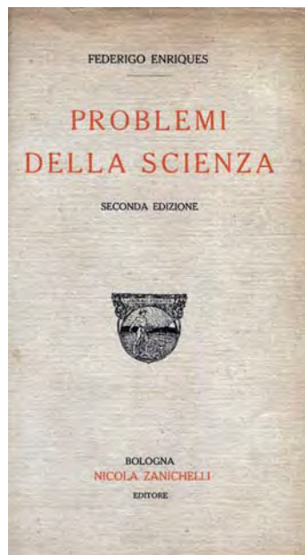
Fig. 32 - Federigo Enriques, Problemi della Scienza , Bologna, Zanichelli, 2a edizione 1910.

La formalizzazione è indubbiamente di grande e spesso indispensabile ausilio per un'opera di ricostruzione, panoramica ma anche e soprattutto critica, come quella di Bourbaki. È naturale che chi ne ha fatto uso traendone tanti frutti la apprezzi, e non si può dire che, dal suo punto di vista, la sopravvaluti se le assegna un ruolo essenziale. Si tratta però di deformazione professionale e di sopravvalutazione se pretende che la prospettiva di chi ammira