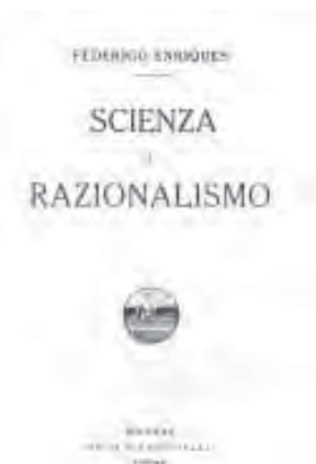
Fig. 33- Federigo Enriques, Scienza e razionalismo, Bologna, Zanichelli, 1912.

Comte conferisce un valore di razionalità dogmatica all'ordine di sviluppo storico della scienza, con la pretesa che tale ordine rispecchi