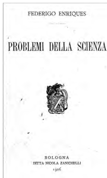
Fig. 31- Federigo Enriques, Problemi della Scienza , Bologna, Zanichelli, 1a edizione 1906.

Fra queste le opere che contengono maggiormente le sue riflessioni filosofiche originali sono: Problemi della scienza ; Scienza e razionalismo ; Il significato della storia del pensiero scientifico ; Causalità e determinismo nella filosofia e nella storia della scienza .